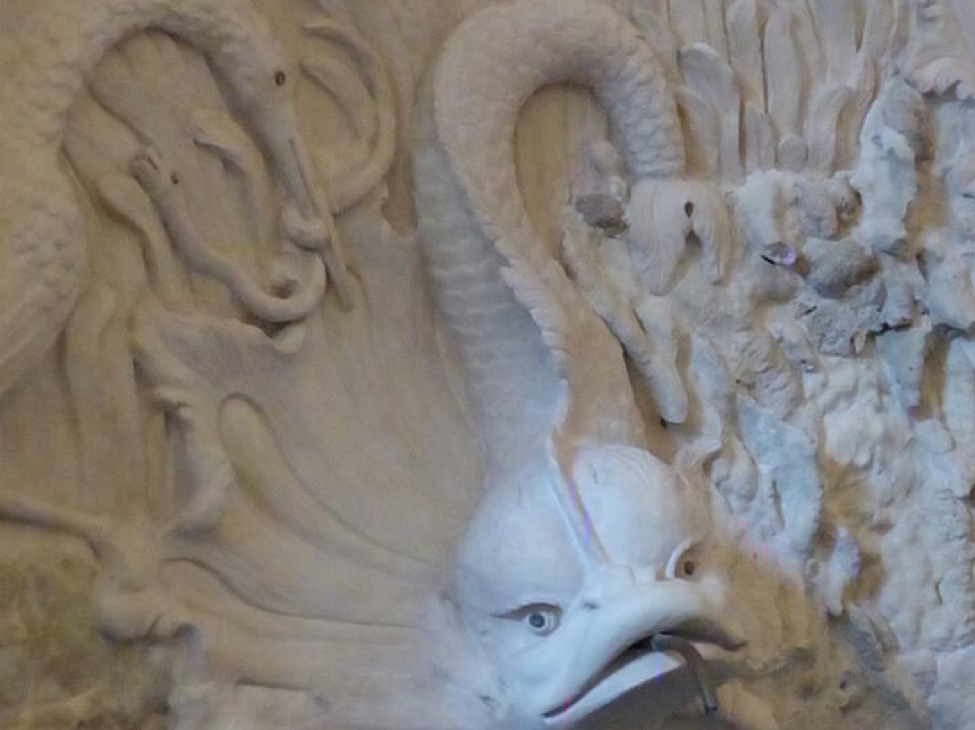
Visite guidée Saint-Antoine au fil du temps - Le temps de la curiosité : curiosités minérales ou a 38160 Saint-Antoine-l'Abbaye

Visite permettant de découvrir des espaces qui ne sont pas ouverts au public.